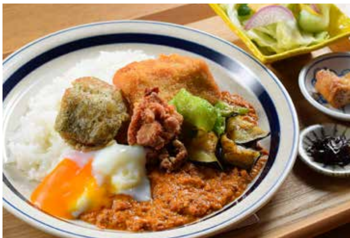
全のセスペシャル サラダセット

水を一切加えず、野菜の水分と10種類以上のスパイスを使用して12時間かけて作った本格的なスパイスカレーです。