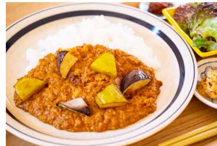
農家の無水カレー サラダセット