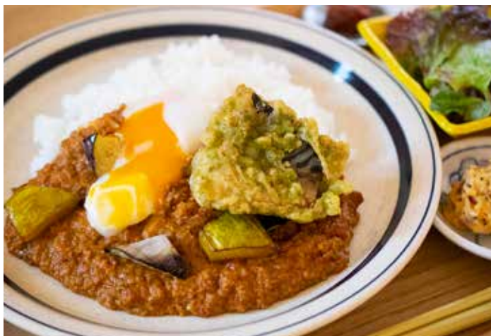
さば竜田温玉 サラダセット