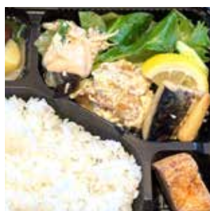
おくどさんの ヘルシー弁当