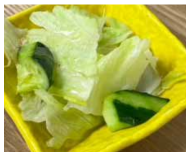
小鉢各種 又は サラダ単品