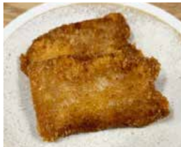
ひとくちカツ (2 枚)