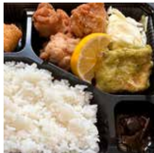
鯖竜田&唐揚げ弁当