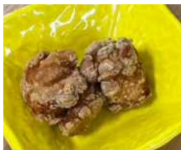
唐揚げ (2 個)