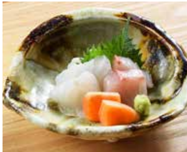
旬魚の 刺身盛り合わせ